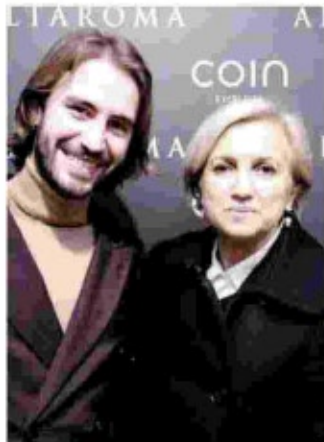
Beretta e Venturini Fendi