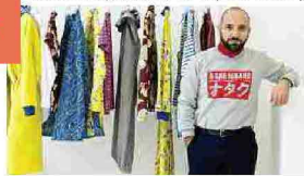
Biasi e i look di A-Lab Milano

Seconda giornata di esposizione per altri dieci giovani brand scelti da Altaroma nel progetto ShowCase, dove