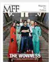
MFF 87 - The wowness