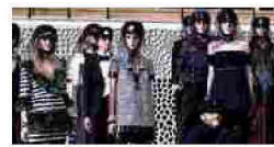
L'omaggio di Chanel a Kaiser Karl