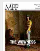
MFF 85 - The wowness