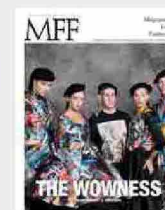
MFF 84 - The wowness