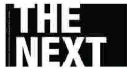
THE NEXT 20