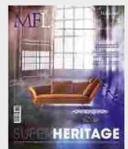
MFL 40 - Superheritage