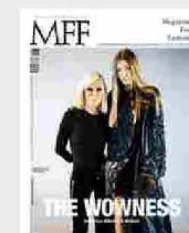
MFF 83 - The wowness