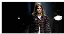
L'odissea dis-order by Undercover e TheSoloist