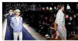
Le icone timeless di Brooks brothers