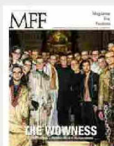
MFF 86 - The wowness