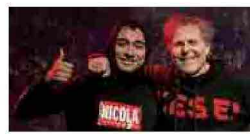
La nuova Diesel secondo Rosso