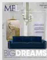
MFL 39 - Bigdreams