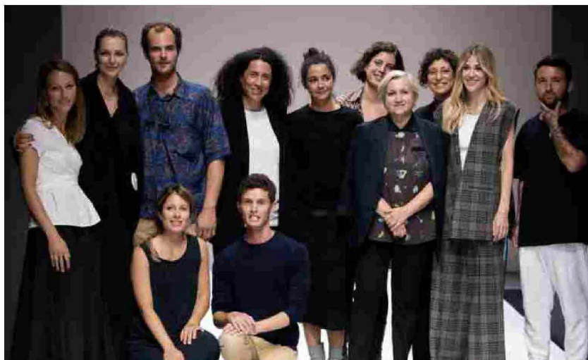
I vincitori di Who is on next? 2018